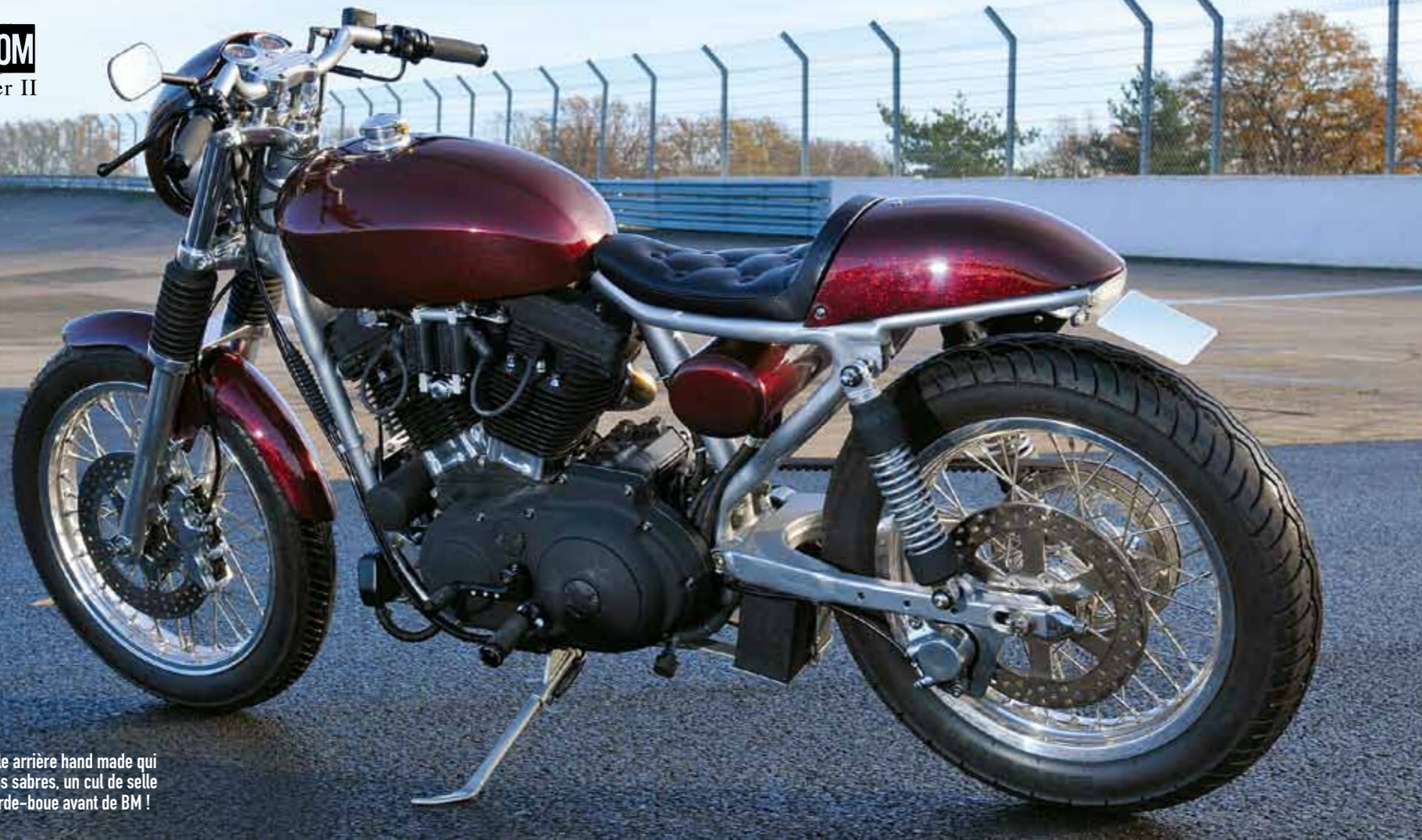
Sur la boucle arrière hand made qui remplace les sabres, un cul de selle tiré d'un garde-boue avant de BM !

regagnent en refroidissement grâce à un radiateur d'huile de BMW qui opère avant le retour du lubrifiant vers le bac à huile maison. Il est constitué de deux demis silencieux en inox de Buell qui traînaient à l'atelier, et sacrifiés sans remords vu que Louis himself fabrique le deux en un dans le même métal, avant d'y emmancher une sortie SuperTrapp qui ne risque pas de gêner dans les courbes... La batterie trouve donc une nouvelle place sous l'ancrage du bras oscillant, perforé et suspendu par des amortos Fox, et entre lequel tourne une des deux jantes alu Akront rayonnées d'inox sur leurs moyeux H-D d'origine. Celle-ci, de 18" par 2,75", est chaussée d'un Metzeler qui n'excède pas 120 mm de large.